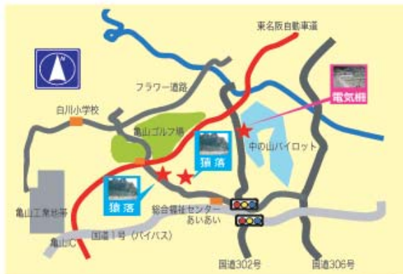
地図：戸田春華氏作成

囲み柵だけでは、サルはしつこく入ろうとします。接近してきたらサルを追ひ払って、サルの寄り道コースからはずすことが大切です。